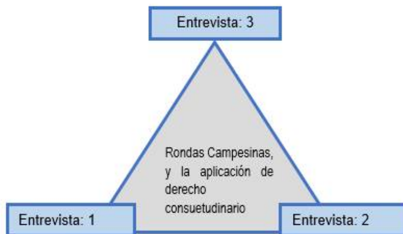
Figura 2. Triangulación de las entrevistas

Para obtener la información se ha recurrido al contenido de las entrevistas efectuados a los 3 ronderos que alguna oportunidad ha asumido la función de aplicar el derecho consuetudinario dentro de su jurisdicción y solamente a ellos (as) se aplicó la guía de entrevista de investigación cualitativa.