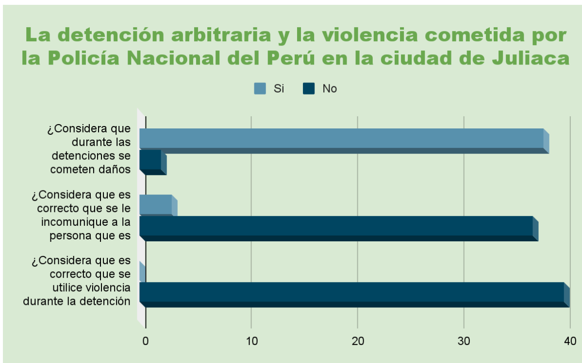
Figura 02: La detención arbitraria y la violencia cometida por la Policía Nacional del Perú en la ciudad de Juliaca.