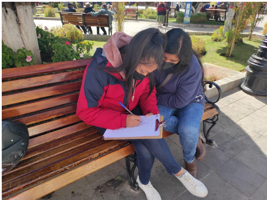
Figura 04. Realizando la encuesta a pobladores