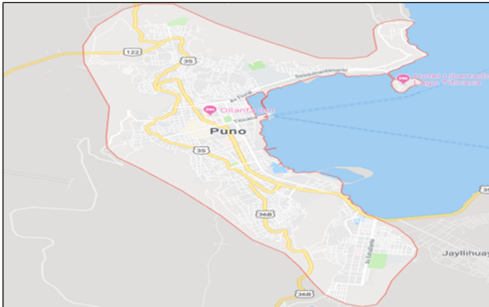
Figura 01. Ubicación geográfica de la ciudad de Puno

En lo social la población de la ciudad de Puno cuenta con una buena parte de empleados públicos por ser la capital de región, además cuenta con una universidad estatal y varias privadas. El estudio se realizó durante los meses de enero a abril del año 2022.