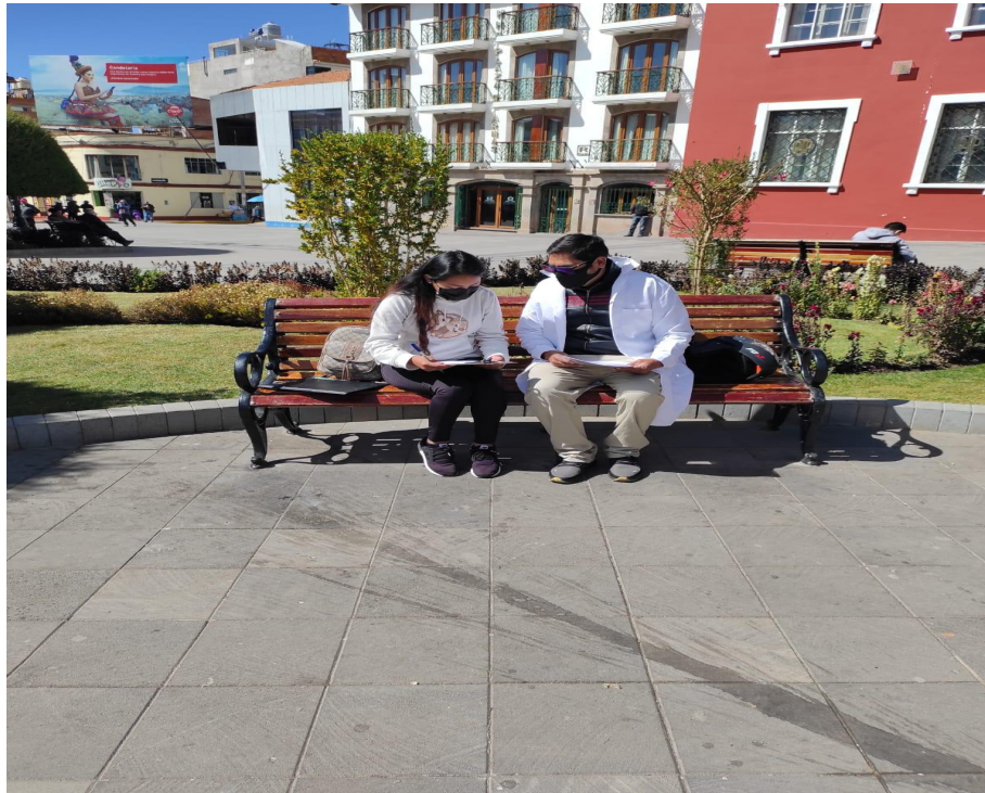
Figura 06. Realizando la encuesta a pobladores