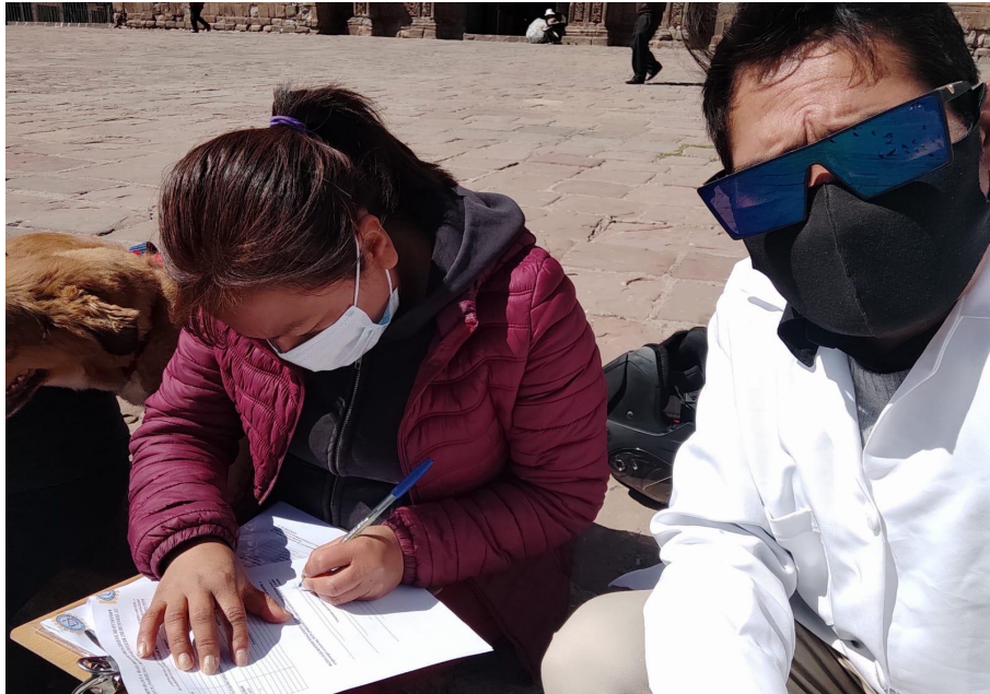
Figura 05. Realizando la encuesta a poblador