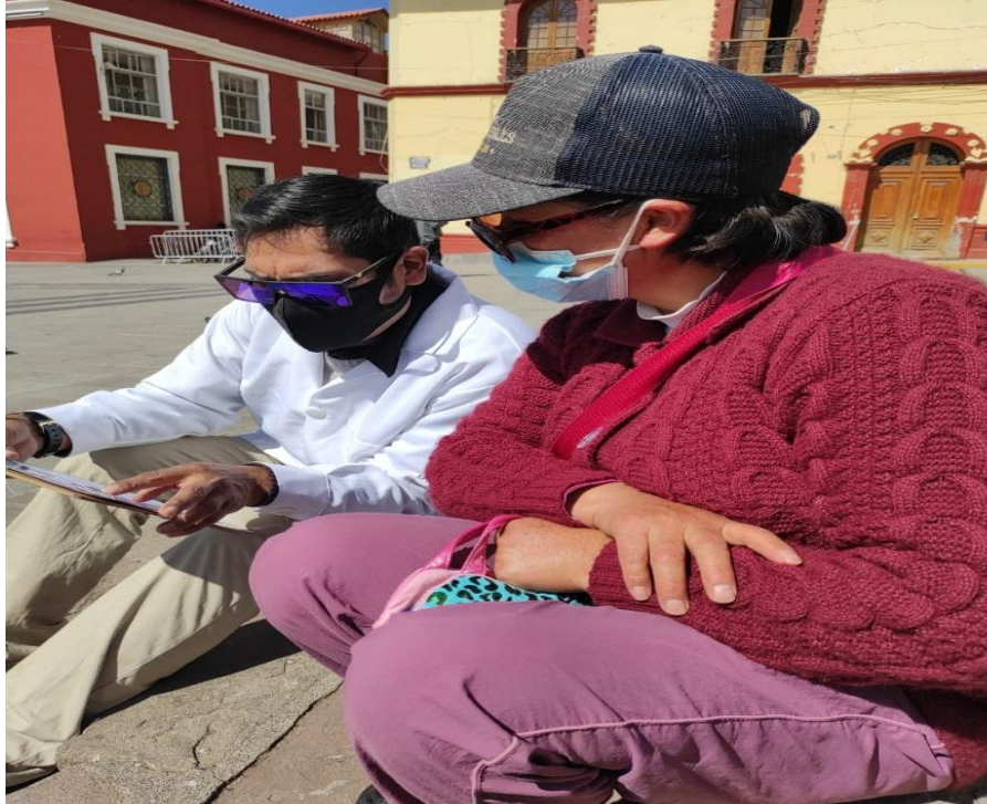
Figura 03. Realizando la encuesta a poblador